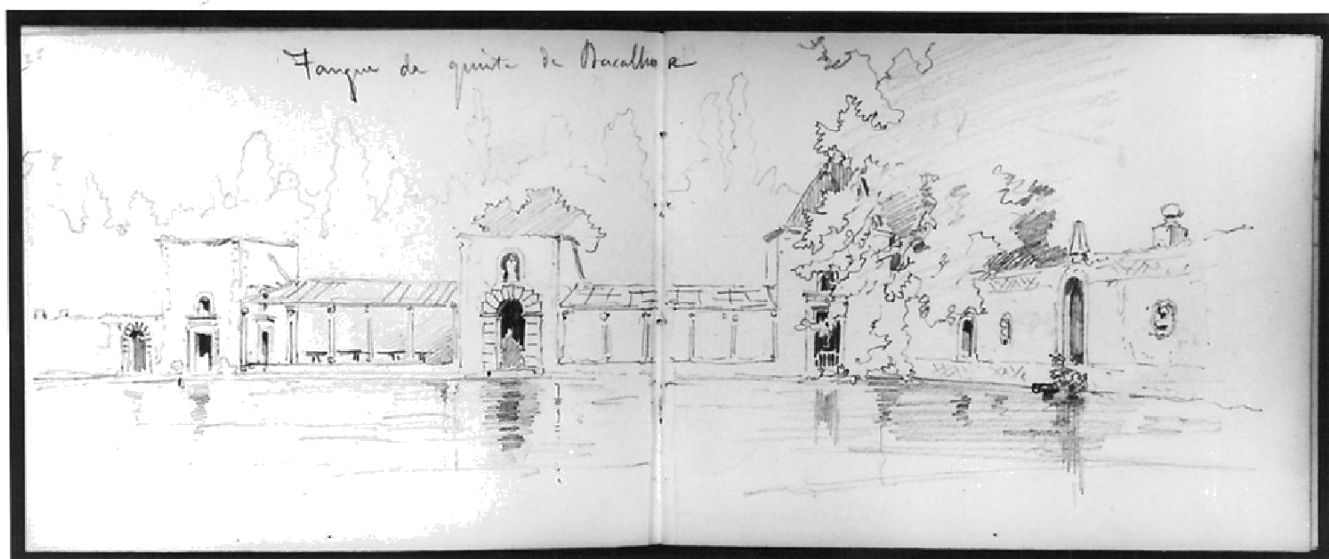
Figura 3 – Desenho a carvão da casa dos Prazeres, na Quinta da Bacalhôa, realizado pelo Rei D. Carlos I.