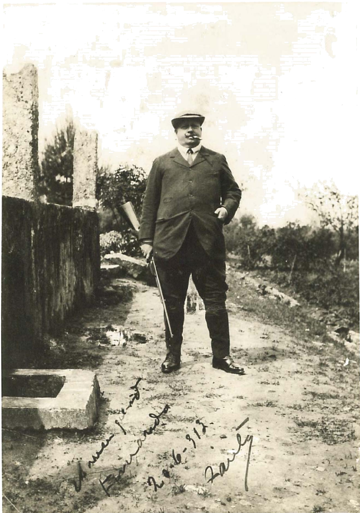
Figura 1 – Rei D. Carlos I a caçar na sua propriedade, Quinta da Bacalhôa, em 1906.