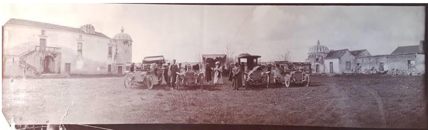
Figura 8 – Rei D. Carlos I e Rainha D. Amélia no Palácio da Bacalhôa