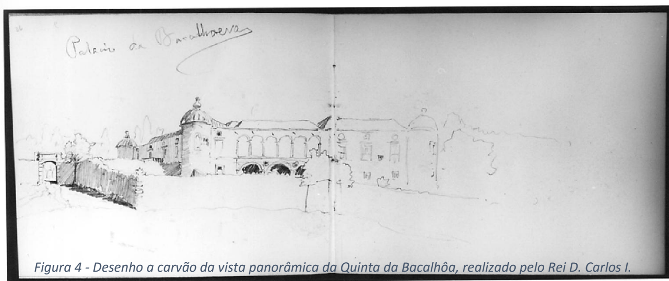
Figura 4 - Desenho a carvão da vista panorâmica da Quinta da Bacalhôa, realizado pelo Rei D. Carlos I.