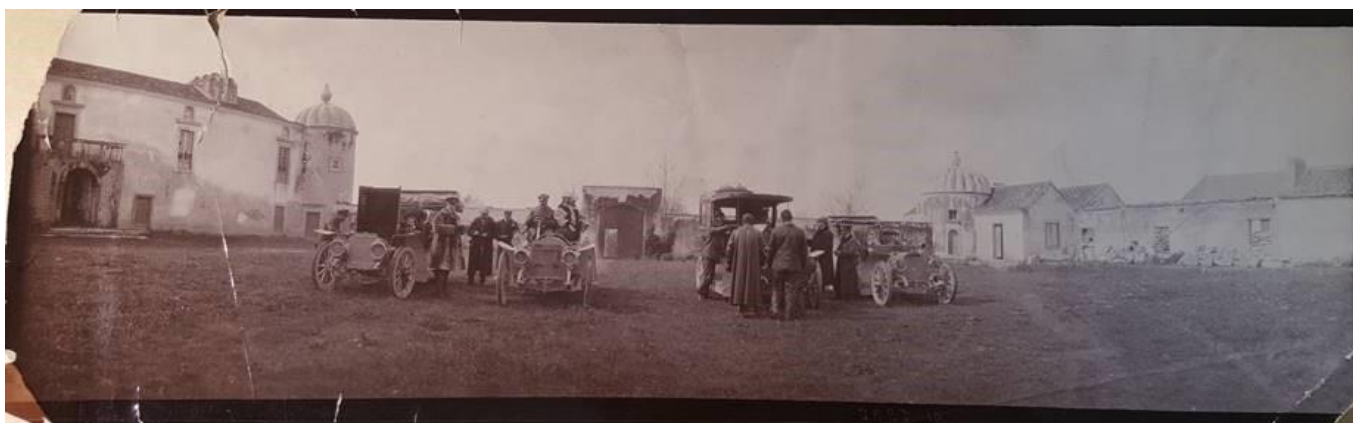
Figura 7 – Rei D. Carlos I e Rainha D. Amélia no Palácio da Bacalhôa