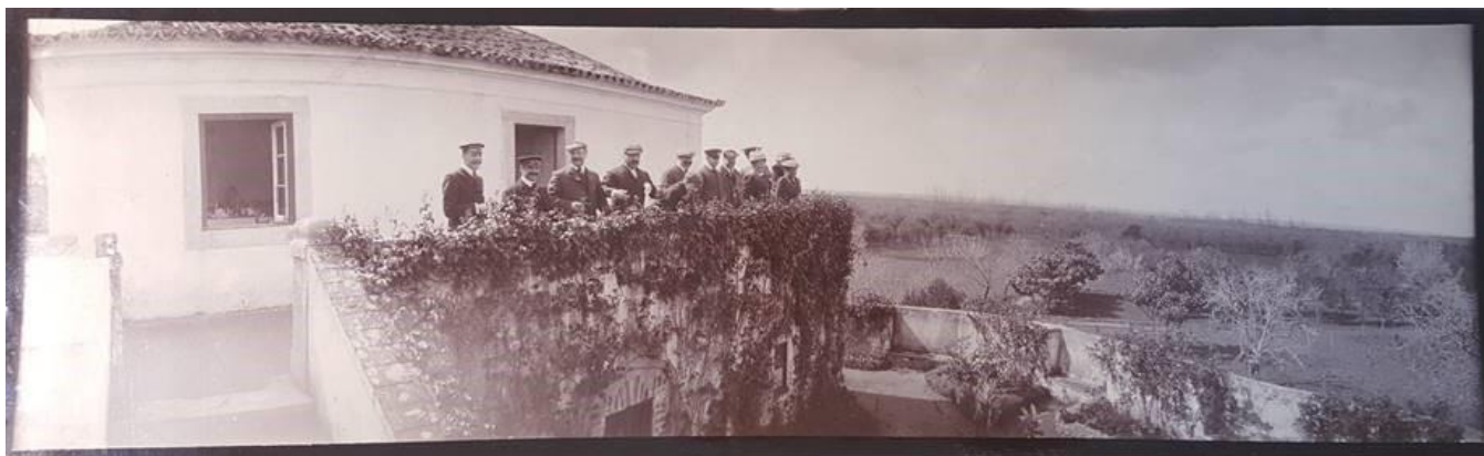
Figura 6 – Rei D. Carlos I e convidados no Palácio da Bacalhôa